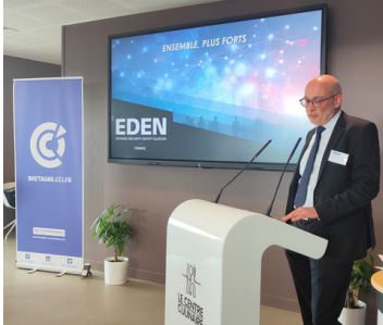
Conférence de presse CCI Bretagne en vue de la domiciliation EDEN Bretagne