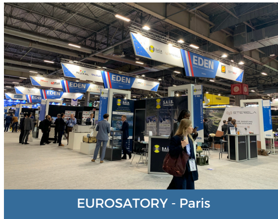
EUROSATORY - Paris