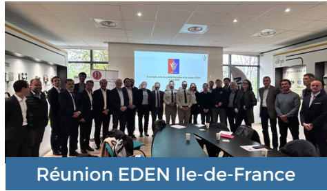
Réunion EDEN Ile-de-France