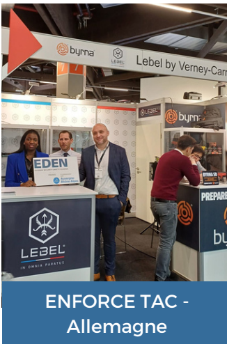
ENFORCE TAC - Allemagne