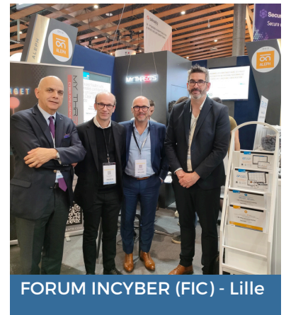
FORUM INCYBER (FIC) - Lille