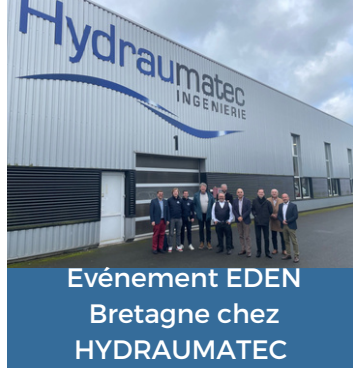
Evénement EDEN Bretagne chez HYDRAUMATEC